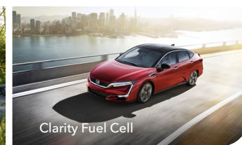
Clarity Fuel Cell