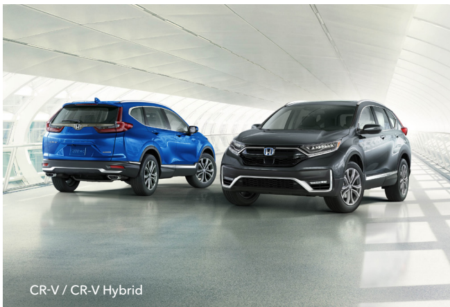
CR-V / CR-V Hybrid