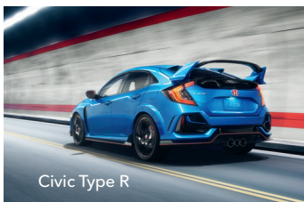
Civic Type R