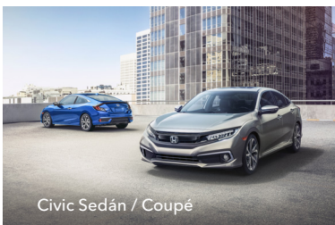
Civic Sedán / Coupé