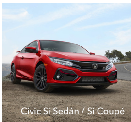
Civic Si Sedán / Si Coupé